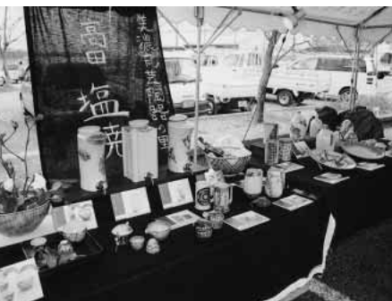
「塩焼」の展示コーナー

また、会場の一角には、国及び県から補助金を受け、昨年度に取り組み完成した「塩焼」のコーナーが設けられ、来場者から関心を集めていた。塩焼とは、高田地区の粘土に岩塩を加えて焼き上げた陶器で、落ち着いた色合いが特徴となっている。