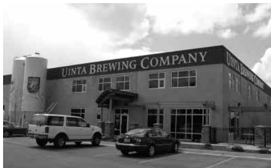
地ビール会社・UINTA 社の外観