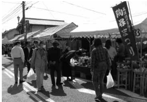
たじみ陶器まつり

れ、目玉の廉売市では、市内の窯元や陶器卸会社約五十社がテント六十四張りを並べ、格安に陶器類が購入できるとあって、多くの買い物客が足を運んだ。 今年も、美濃焼応援団長と銘打って、中津川市(旧福岡町)出身でニュースキヤスターの草野満代さんを迎え、焼き物をテーマにトークショーが開かれた。その他、大道芸や若手陶芸家が制作した湯呑百点が抽選で当たる福引なども行われ、まつりを盛り上げていた。