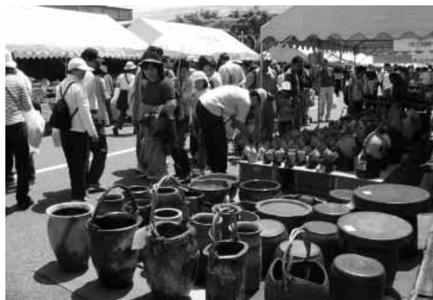
土岐美濃焼まつり