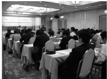
各議案について審議