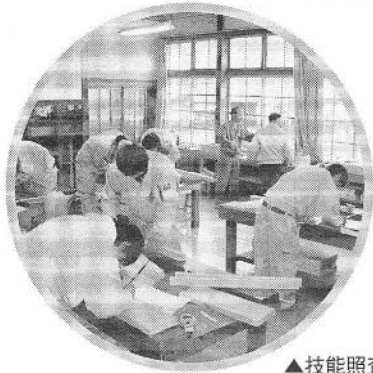
▲技能照査の課題に取り組む訓練生

建築業界としての後継者育成と、組合員事業所の人材確保を目的に、組合や地域の枠を超えて同業者が連携。職業訓練法人を設立し、職業能力開発校の運営に取り組んでいる